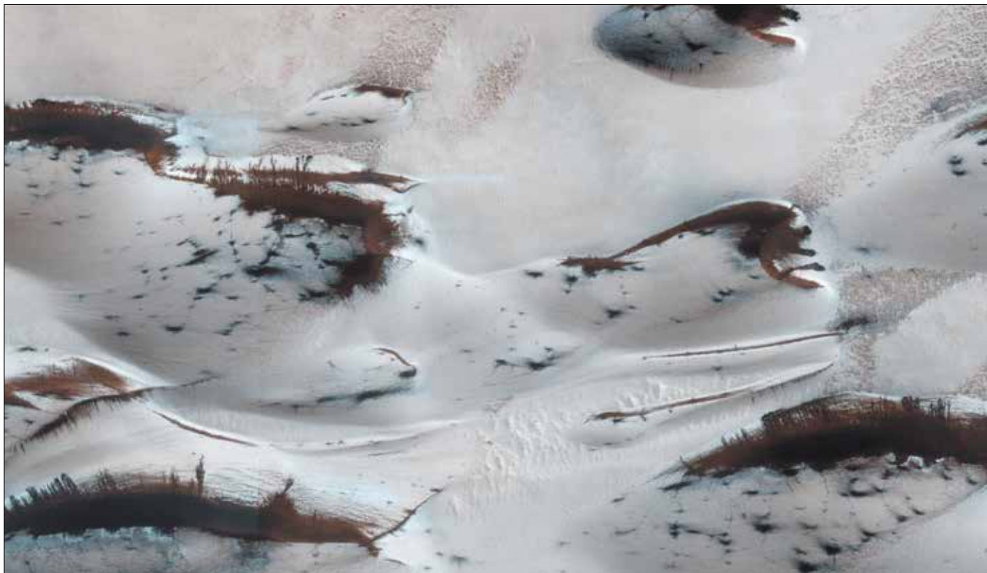
Forår på Mars. Efterhånden som solen får magt, bryder sandklitter langsomt frem under vinterens snedække af fast kuldioxid (tøris). De fine striber menes at være resultatet af sandskred på de stejle skråninger.

Irritation af slimhinderne kan endvidere udløse trigeminalt medierede beskyttelsesreflekser: De opleves ved, at vejrtrækningen standser med et pludseligt gisp. Refleksen kommer 700-800 ms efter indånding af en kritisk koncentration af \text{CO}_2 , hvilket er tilstrækkeligt til at standse gassen, inden den når lungerne.