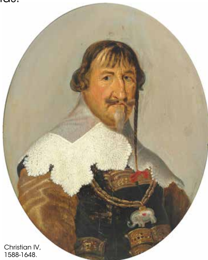
Christian IV, 1588-1648.

"Min fyrstelige Naade Prinsen er i Folkemunde for Behandlingen af en berømt Skarprefter fra Glückstadt. I bedste Hensigt blev han i Slutningen af forrige Aar sendt hertil af kongelig Majestæt; men som Følge af stadig udvortes Anvendelse af stærkt kølende og opstrammende Midler saasom Galæbler, Soda, Vitriol og Eddike bibragte han den angrebne Fod Kulde, Stivhed, Følelsesløshed og Koldbrand; efter Væskernes Tilbagetrængen i Legemet kom der tillige Trangbrystethed, usædvanlig Uro, Smerte i Mellemgulvet, Tilstopning af Milten og samtidig stærkt Flod af Hæmorrhoider. Gennem samfulde to Maaneder og mere til har nævnte Empiriker, der var saa skikket til denne Behandling som et Æsel til at spille paa Lyre, forestaaet Kuren, og førend den blev ham overdraget, og saa længe den har staaet paa, har jeg ikke saa meget som set den angrebne Fod, langt mindre er jeg blevet taget med paa Raad... Jeg lader dig vide, at min fyrstelige Naade Prinsen har været lænket til sit Leje i de sidste to Maaneder - efter at merbemeld-