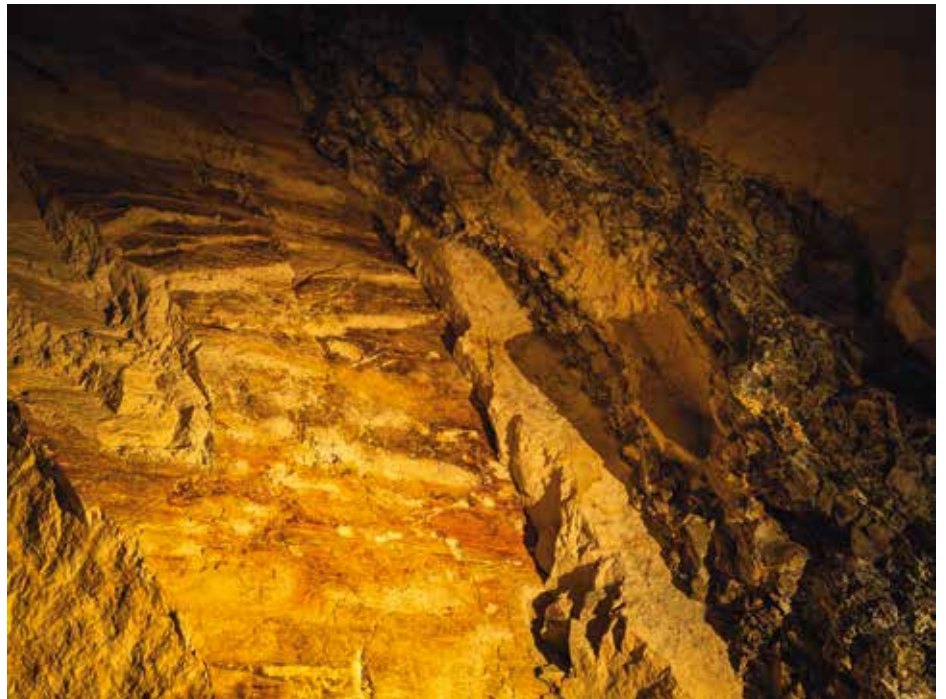
Figur 1. I kalkminen kan man se noget, man sjældent ser i en kystprofil: selve lagplanet. Når man står under loftet i minerne, afsløres "trin" i lagfladen, så man fornemmer, at kalken ligger som store, sammenhængende plader gennem undergrunden. De mørke striber er flintzoner, som følger bestemte niveauer i kalken, en slags "geologisk lineal", der gør lagdelingen ekstra let at aflæse. Samtidig ses sprækker og brud, der minder om, at kalken ikke bare er aflejret i et hav, men også senere er blevet påvirket af bevægelser i undergrunden.

Kalk er, kemisk set, mestendels calciumcarbonat, \text{CaCO}_3 . I dansk geologi dækker ordet både over kridt (meget fin-