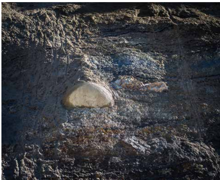
Figur 3. Den store lyse klump i moleret er en cementsten . Den repræsenterer en anden måde at danne kalk på end almindelig lag-for-lag sedimentation: i stedet for at være aflejret som et lag, er den vokset inde i sedimentet, mens havbundsmudderet stadig var relativt blødt. Det sker, når porevandet i sedimentet bliver rigt på opløst karbonat, så calcium kan udfælde og cementere et område til en hårdere, mere kompakt klump, ofte omkring et lille nukleationskim, det være sig en skalrest eller en kemisk grænse i sedimentet. I praksis bliver sådan en cementsten en lille geologisk kapsel: den kan bevare strukturer og fossiler anderledes end det omgivende moler og den viser, at kalkens historie ikke kun handler om hav og aflejring, men også om kemi i porerum efterfølgende.