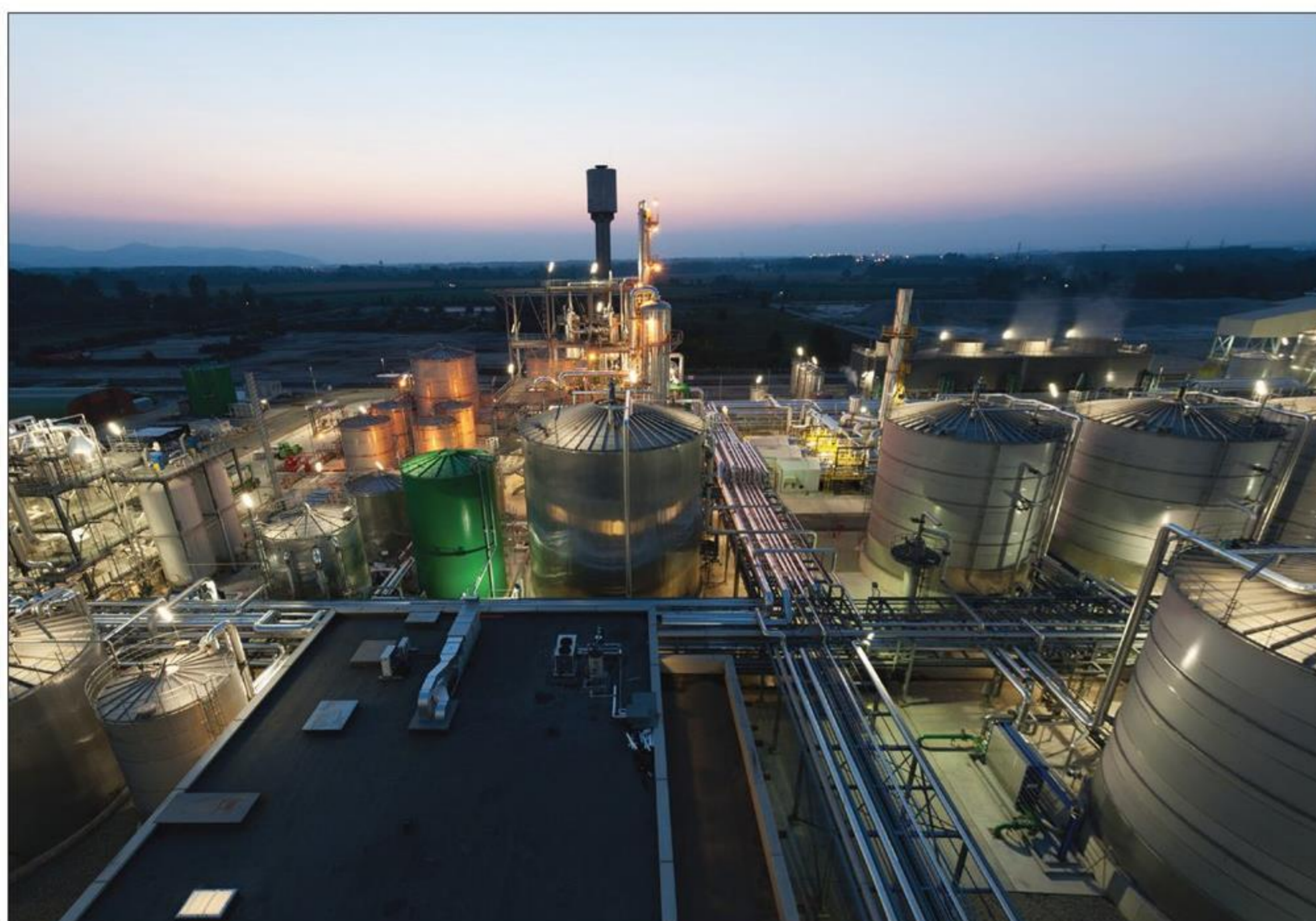
Anlægget ved Crescentino.

anlægget. Allerede måneden efter var det Abengoa, som kunne trykke på knappen i Hugoton, Kansas, USA. Senest er Raizèn i december måned begyndt at producere ethanol af sukkerrørs bagasse nær Sao Paolo i Brasilien. Opførelsen af flere kommende anlæg i både EU, Kina, Nord- og Sydamerika er annonceret.